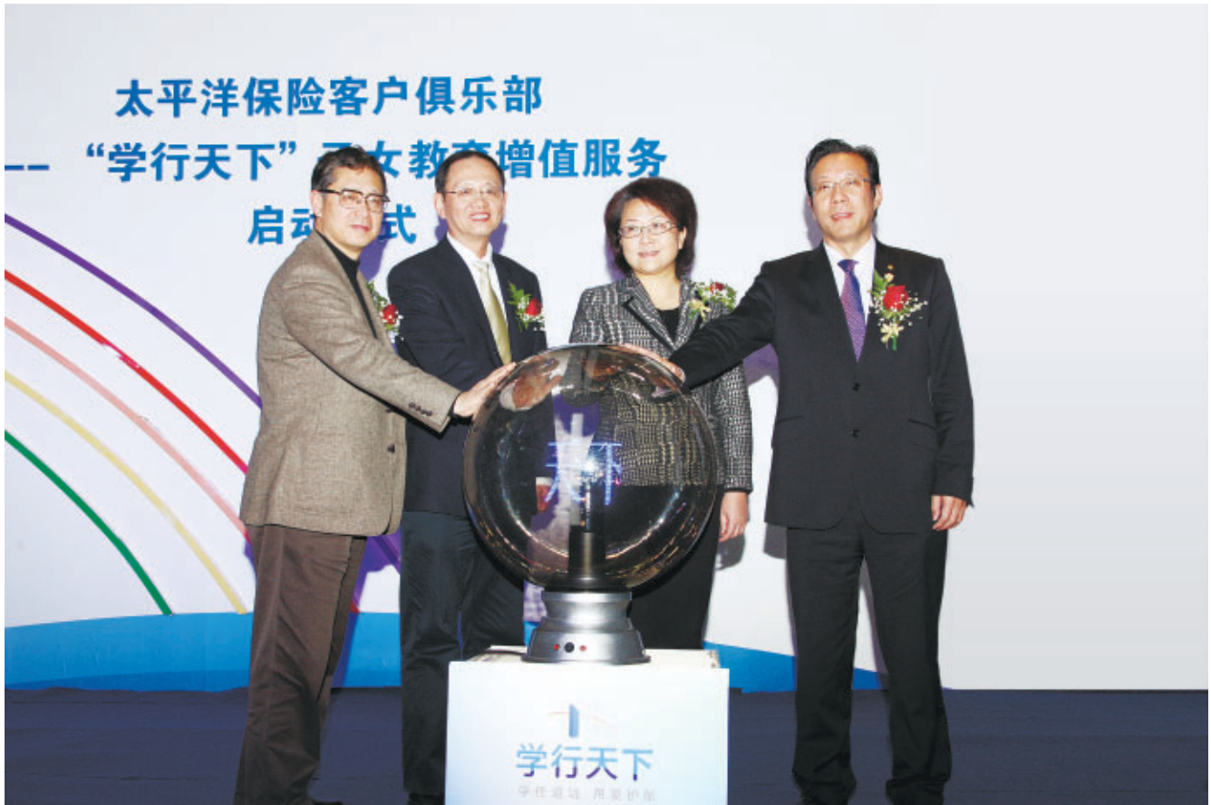
太保壽險推出“學行天下”子女教育增值服務