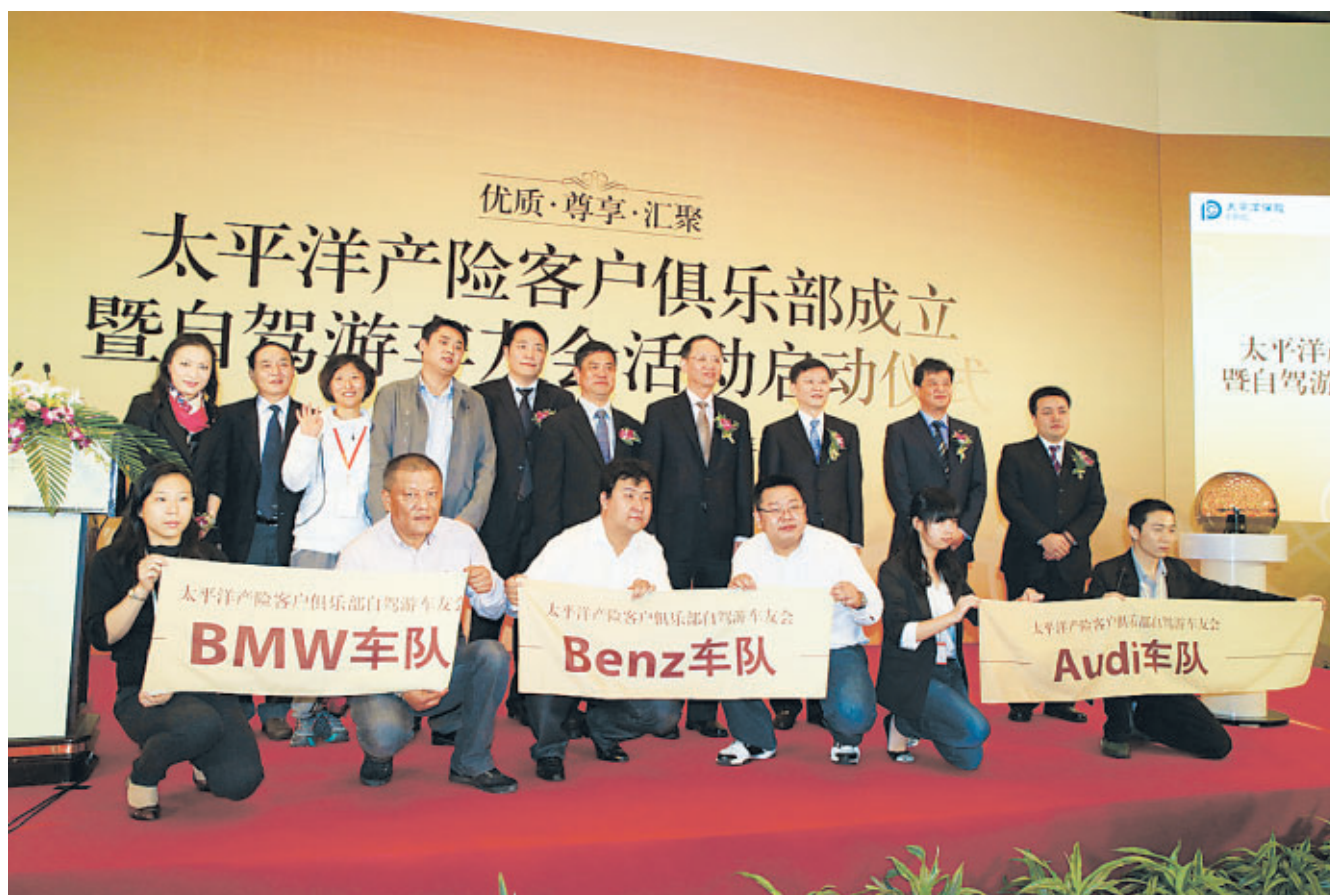
太平洋產險客戶俱樂部成立暨自駕遊車友會活動啟動儀式