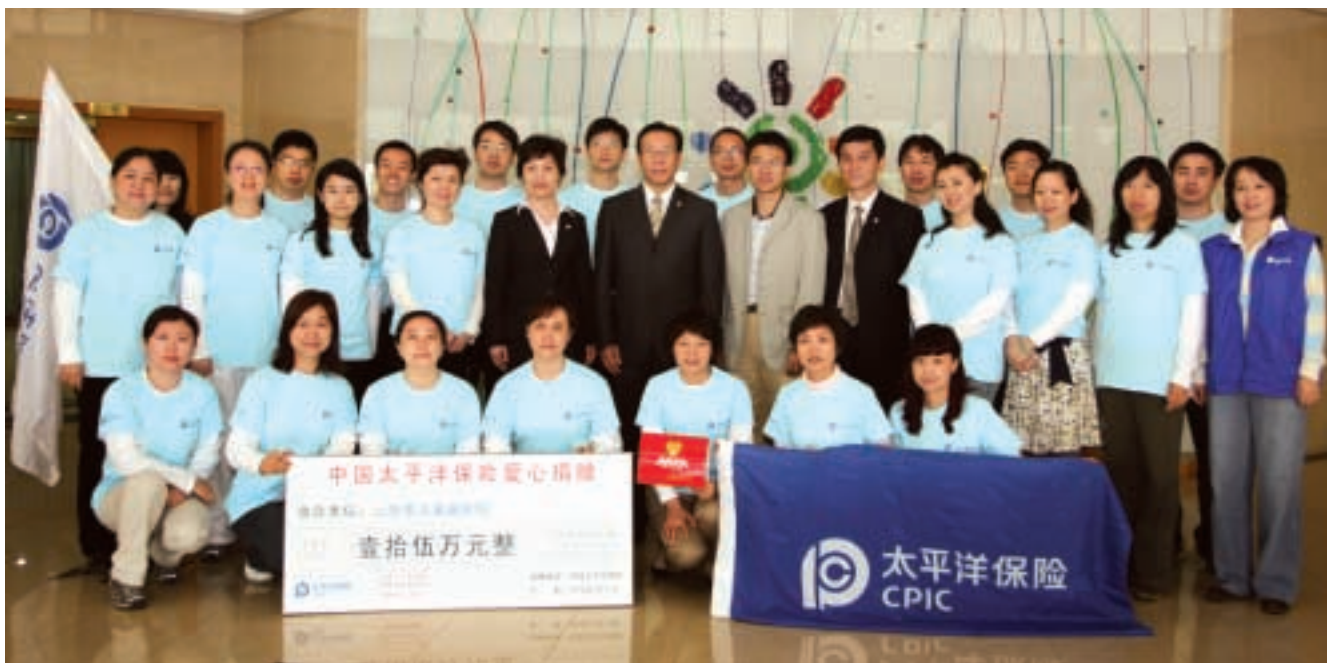
2010年5月13日(司慶日)，中國太保在上海市兒童福利院開展公益活動

十二、 持股5%以上股東報告期內追加股份限售承諾的情況 報告期內本公司持股5%以上的股東無新增追加股份限售承諾的情況。