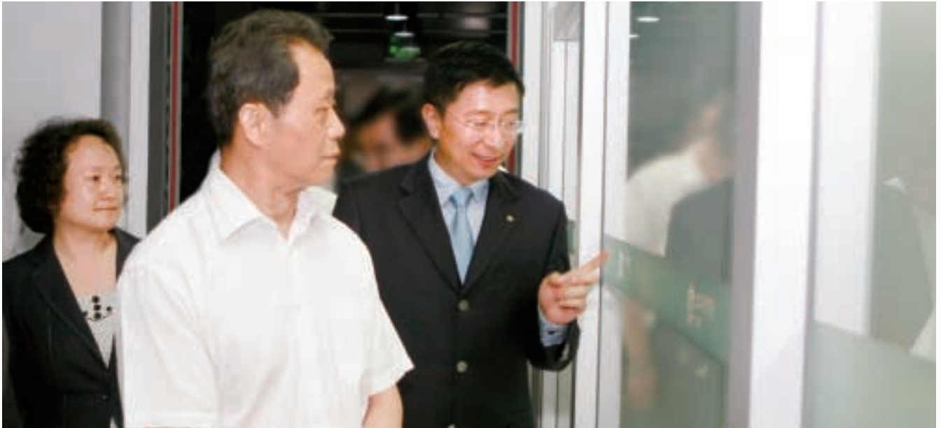
保監會主席吳定富視察中國太保數據中心

2010年上半年，面對複雜多變的國際國內經濟金融形勢，得益於中國經濟基本面進一步回升向好等保險業內外部發展環境的積極變化，中國保險市場保持了良好的發展勢頭，但不可避免也受到了資本市場震盪的影響。面對機遇與挑戰，中國太保冷靜面對經營過程中的困難和問題，圍繞可持續價值增長的目標，堅持轉變發展方式，優化業務結構，實施穩健的投資策略，有效防範風險，加快提升營運支持能力，繼續保持良好的發展態勢。