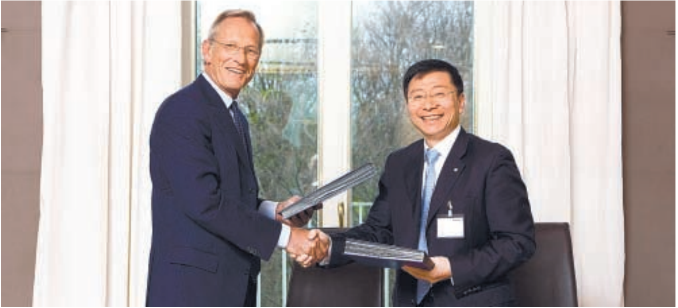
中國太保與德國安聯集團簽署業務合作意向書