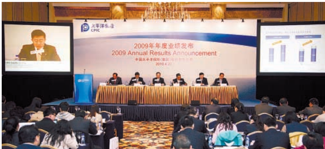
2010年4月20日，中國太保在上海和香港同步召開H股上市後首次年度業績發佈會