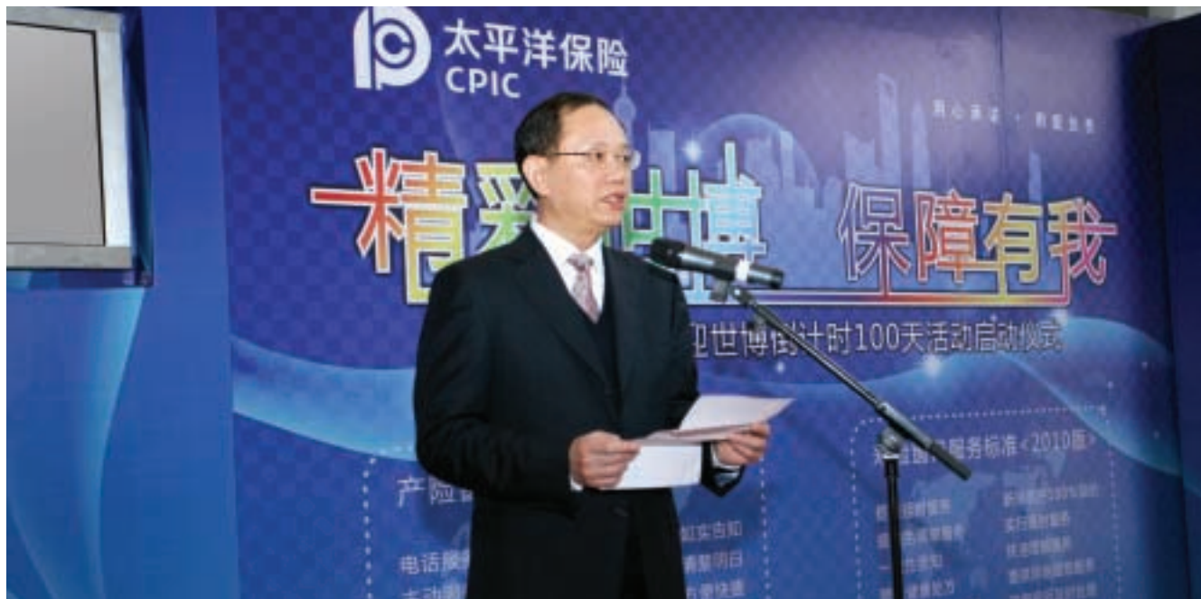
2010年1月19日，中國太保啟動迎世博倒計時100天活動

本公司主要通過下屬的太保壽險、太保產險為客戶提供全面的人壽及財產保險產品和服務，並通過下屬的太保資產管理和運用保險資金。此外，本公司控股長江養老從事養老金業務，還通過太保香港在香港市場從事財產保險業務。